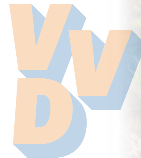
Willem Buunk Lijsttrekker VVD Bronckhorst